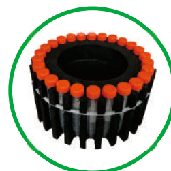
26位试管固定器 (适用15 mL 离心管)